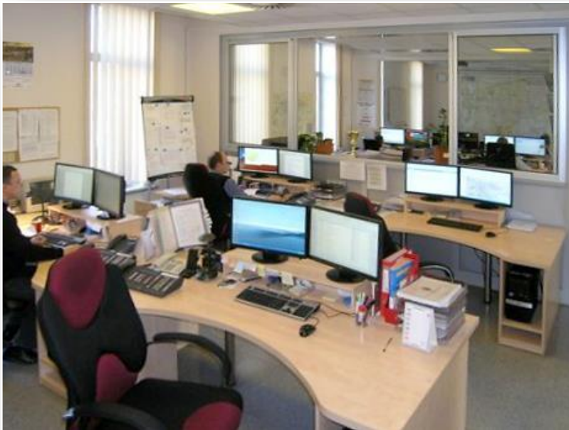
Centrum dowodzenia w Warszawskim Centrum Zarządzania Kryzysowego